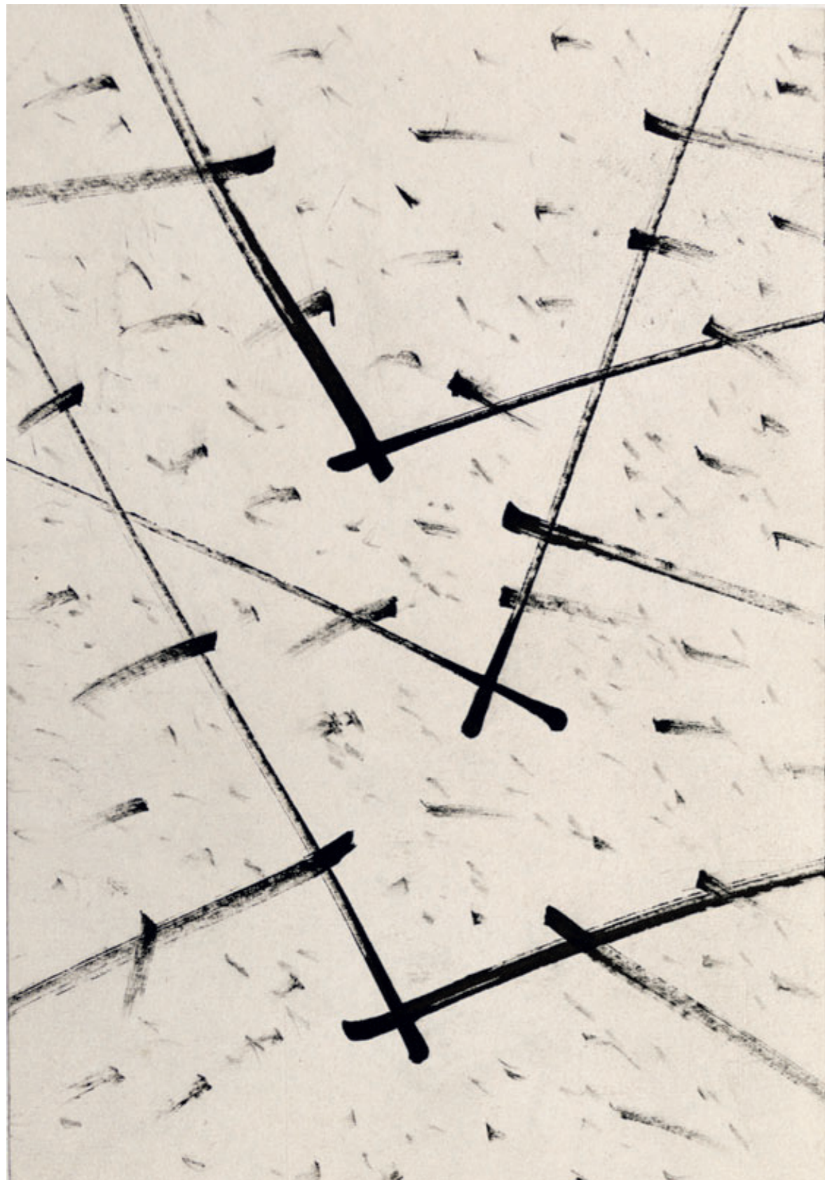
Miroslav Koval, Bez názvu, srpen 2019, 210 x 140 mm, tuš, česnekový stvol, papír